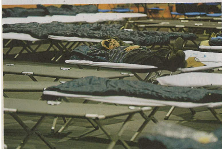
Le gymnase Duplat ouvert mardi permet d'accueillir 120 personnes la nuit.