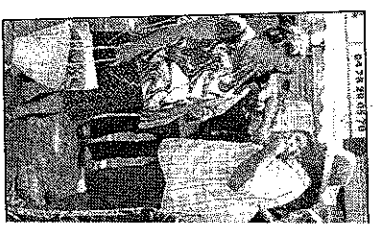
Les Croix-Rous-siens o proposées par l'assoc