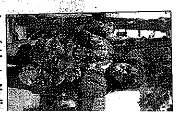
1 - Sandrine Runel, à gauche